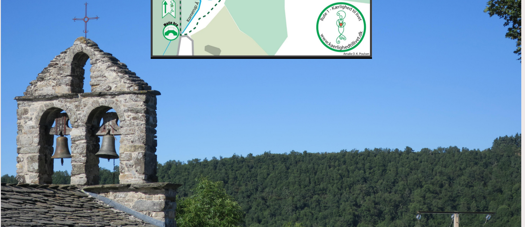
Stemmingsbillede fra spanien