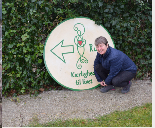
Tine foran det flotte Kærlighed til livet-logo, der med en pil viser startretningen på den lokale "pilgrimsrute".